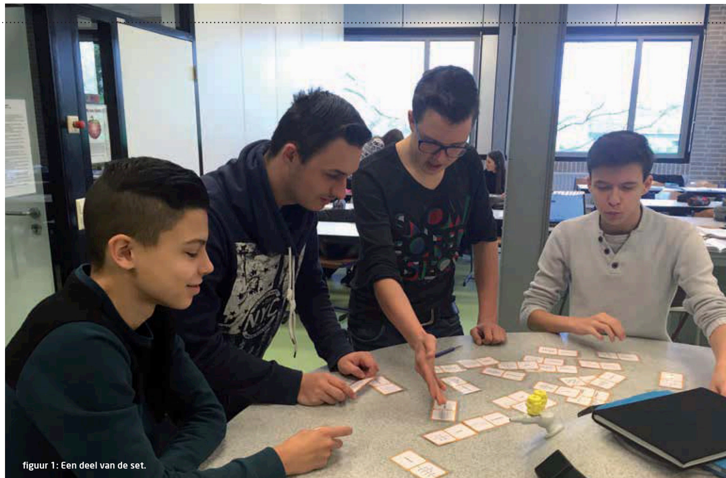
figuur 1: Een deel van de set.

Het is maart 2016. Hoofdstuk 4 is bijna ten einde en de slang kan nu gebruikt gaan worden. De eerste klas van de dag is H3r. De kaartjes worden tevoorschijn gehaald en de groepjes worden gevormd. Ik leg de opdracht uit: "Maak een slang van de kaartjes, waarbij het einde van de slang weer aan moet kunnen sluiten op het begin. Vragen stellen aan de docent mag niet. Overleg met je groepje en houd de boeken gesloten. De groep die als eerste een correcte alkanenslang heeft gemaakt, wint." De groepen staan klaar en de kaartjes worden uitgedeeld. Een goed moment om eens rond te kijken. Wie neemt in de groepjes de leiding? Zijn alle leerlingen erbij betrokken? Kunnen ze de theorie toepassen in deze opdracht? In de wijze van samenwerking binnen de groep zijn wel opvallende verschillen te zien. Zo duikt een van de